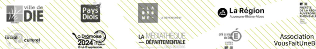
Communication print et web : Les Aires Entrepreneur du spectacle : PLATESV-D-2019-000351 | Ne pas jeter sur la voie publique